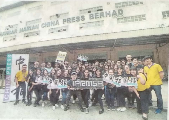
众人在《中国报》印刷厂门外合照。